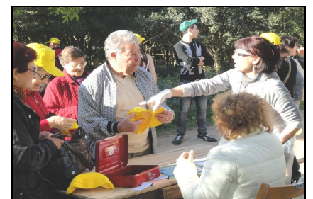
Passeggiata ecologica a S'Isca Manna, consegna cappellini, aprile 2011.