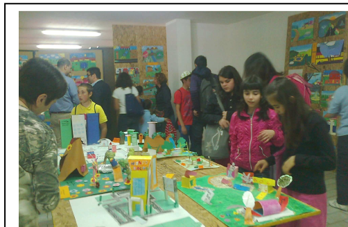
Mostra elaborati concorso "Ti disegno come vorrei il mio paese", maggio 2011.