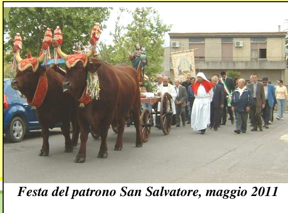
Festa del patrono San Salvatore, maggio 2011

Possono fare richiesta anche operativa nella provincia di Cagliari. invece, i TFO (Tirocini Formativi questo caso, il titolo richiesto è la minima è 18 anni. Per quesiti o per presentazione delle domande di a titolo gratuito, lo sportello Ce.S.I.L ogni venerdì dalle 11.30,