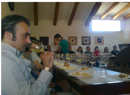
Laboratorio del Gusto in cantina