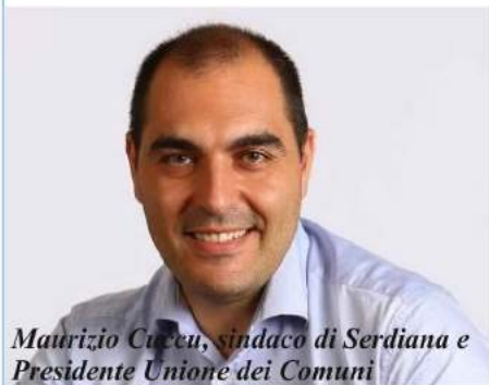
Maurizio Cuccu, sindaco di Serdiana e Presidente Unione dei Comuni

Non è partito certo in discesa il mandato della nuova Giunta capeggiata dal sindaco Maurizio Cuccu. "Siamo entrati in piena pandemia ma il primo anno di rodaggio è andato". Ed è stato un anno intenso, a livello di energie profuse, e di presenza, proprio fisicamente. "L'impegno è stato ripagato dalle soddisfazioni - commenta il primo cittadino di Serdiana - stiamo vedendo realizzarsi tutta una serie di progetti che ci eravamo prefissati, facendo anche i conti con la burocrazia,