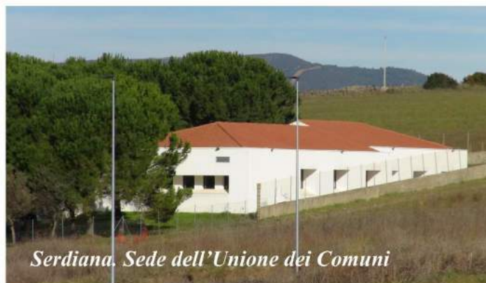
Serdiana, Sede dell'Unione dei Comuni

EFFETTO COVID E RIPARTENZA. Il 2021 è stato un anno caratterizzato dalla pandemia con le immancabili misure restrittive e rallentamenti. "Non è stato bello, soprattutto ad inizio anno, ci siamo trovati in uno stato di grande limitazione, senza possibilità di programmare tutto ciò che avremmo voluto per il nostro paese. Adesso abbiamo diversi cantieri pronti a partire come il rifacimento della pavimentazione di via De Candia, la conclusione di via Mons. Carta, il Monte Granatico". Lavori già affidati relativamente alla chiesa, la sistemazione delle finestre della biblioteca: "Sono tutti cantieri pronti ma stiamo ancora facendo i conti con l'effetto covid, con la difficoltà di reperire le materie prime. E' un po' come partire a freno a mano tirato".