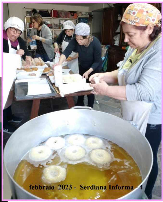
Il gruppo della Proloco